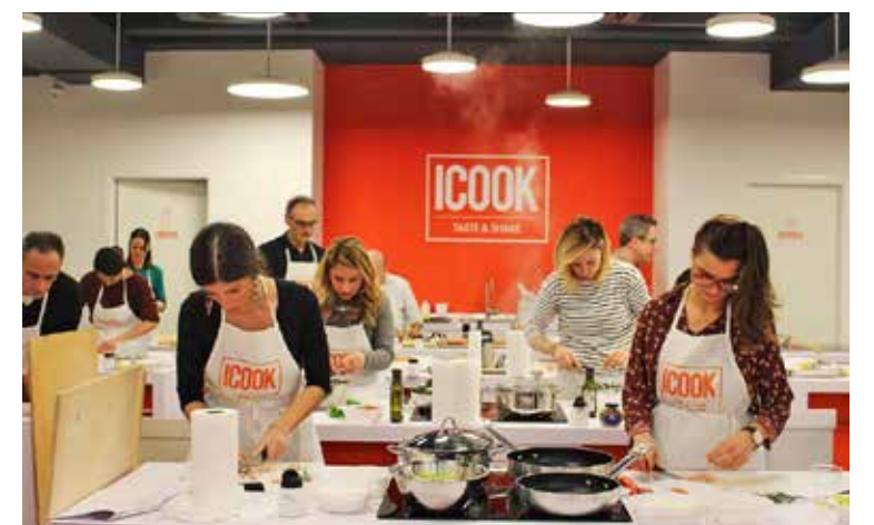
Icook Taste&Share la scuola di formazione di cucina ha realizzato solo nel primo semestre 2024, 50 corsi per totale di 240 ore di lezioni