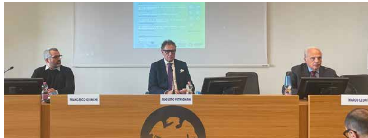
Il convegno sulla "Protezione e resilienza dei dati. La protezione dei dati è la forza della tua azienda" tenuto presso la sede di Confcommercio cesenate