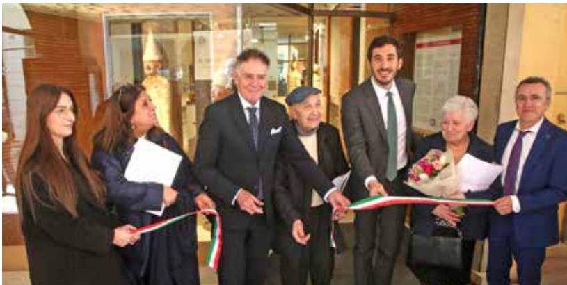
L'inaugurazione del punto d'ascolto di Confcommercio in via Zefferino Re