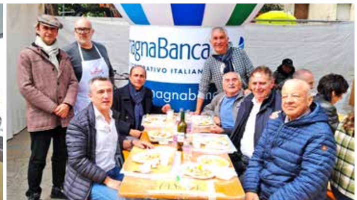
I vertici di Confcommercio allo stand di Arte Confcommercio alla manifestazione "Azzurro come il pesce" a Cesenatico