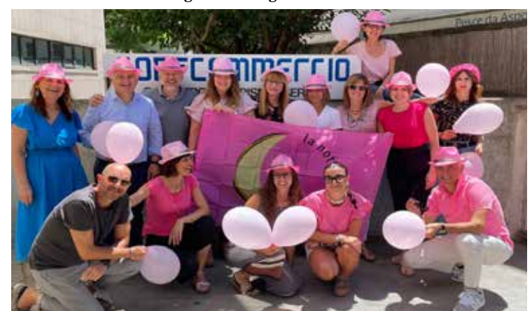
Lo staff Confcommercio di Cesenatico si prepara all'evento "La notte rosa"