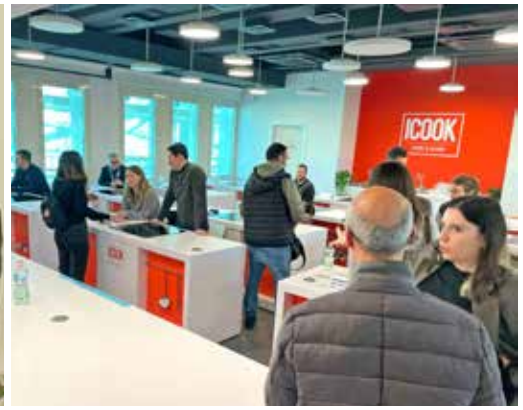
Il Talent Day iniziativa organizzata da Job&Workers in collaborazione con Infojobs, Iscom Formazione e Fipe Confcommercio.