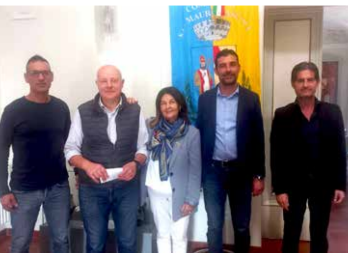
i rappresentanti di Confcommercio all'incontro con sindaco e vicesindaco di San Mauro Pascoli