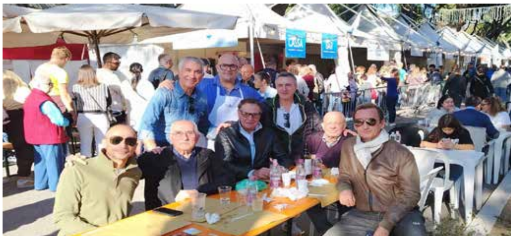
i vertici di Confcommercio alla riuscitissima manifestazione "Il pesce fa festa" a Cesenatico