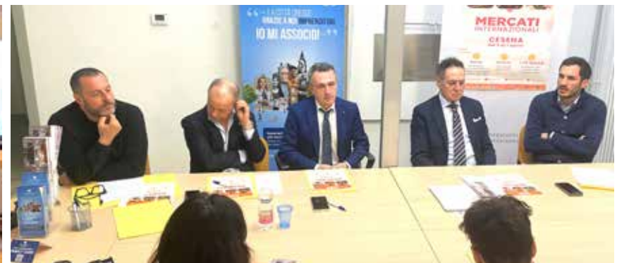
La conferenza stampa di presentazione dell'evento promosso da Fiva Confcommercio "Regioni d'Europa. Mercato internazionale"