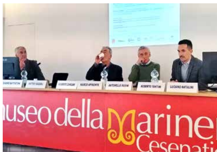
Il seminario su "L'impatto del cambiamento climatico sul turismo balneare" tenuto a Cesenatico, organizzato dall'Accademia del Clima e dall'Ente bilaterale Terziario cesenate, con la sponsorizzazione di Confcommercio cesenate.