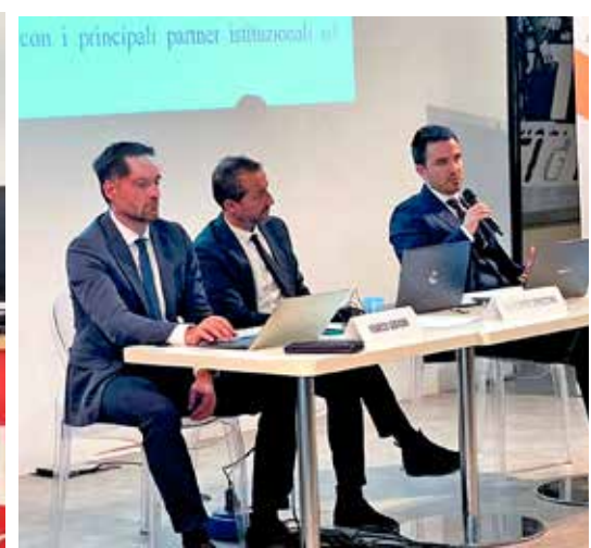
Una lezione del ciclo di quattro incontri formativi promossi da Rigenera Impresa Confcommercio e Teikos Solutions