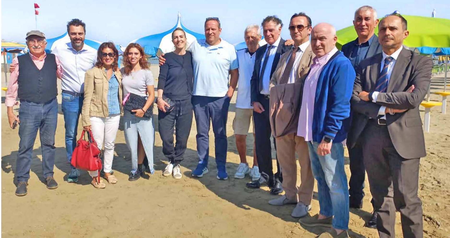
I vertici di Confcommercio cesenate e delle categorie turistiche della riviera

IL COMMENTO Anche i cittadini debbono remare a favore del turismo